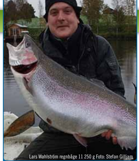
Lars Wahlström regnbåge 11 250 g