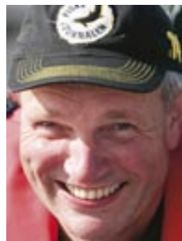
Rutinerade trollaren Rydarn kan Ruskenfisket utan och innan.

Jag undrar om jag fört över gårdagens "gösförbanelse" – inte en landad gös – från min egen båt till Rydarns ekipage. Ingen fara visar det sig. Nästa fisk är en gös... och nästa... och nästa. Inga bjassar men