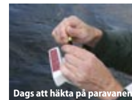
Dags att häkta på paravanan.