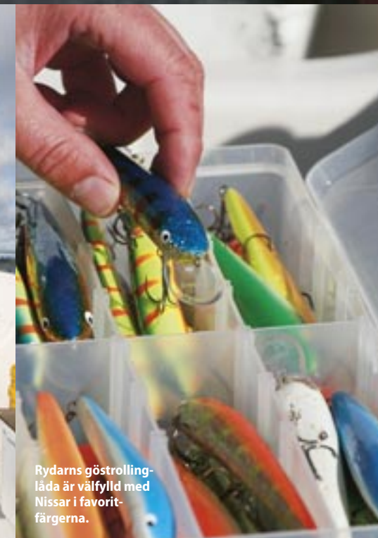
Rydarns göstrollingslåda är välfylld med Nissar i favoritfärgerna.