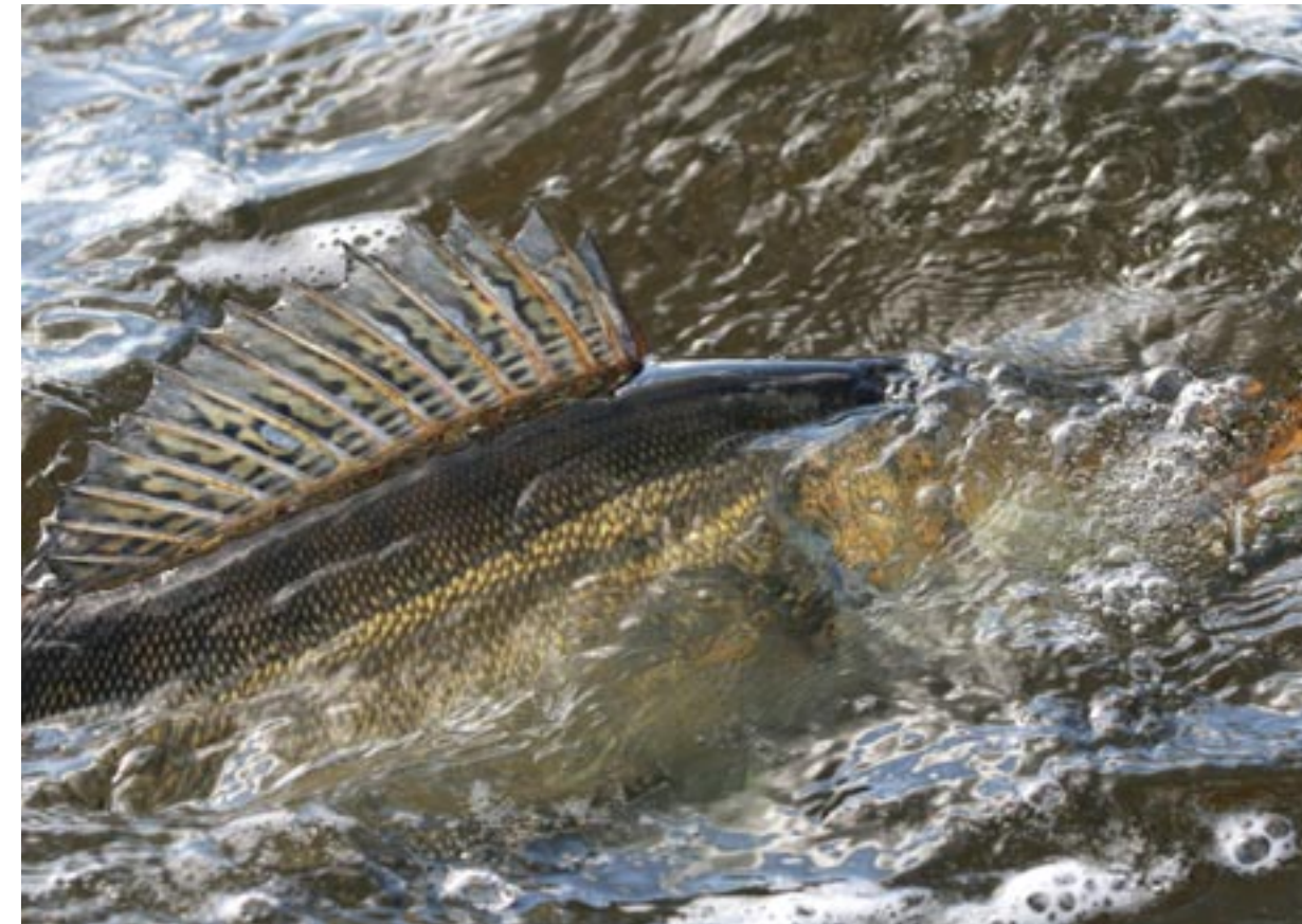
Rusken håller mängder av gös i mellanklassen. Varje år kommer det dock upp ett antal fiskar runt fem-sex kilo.