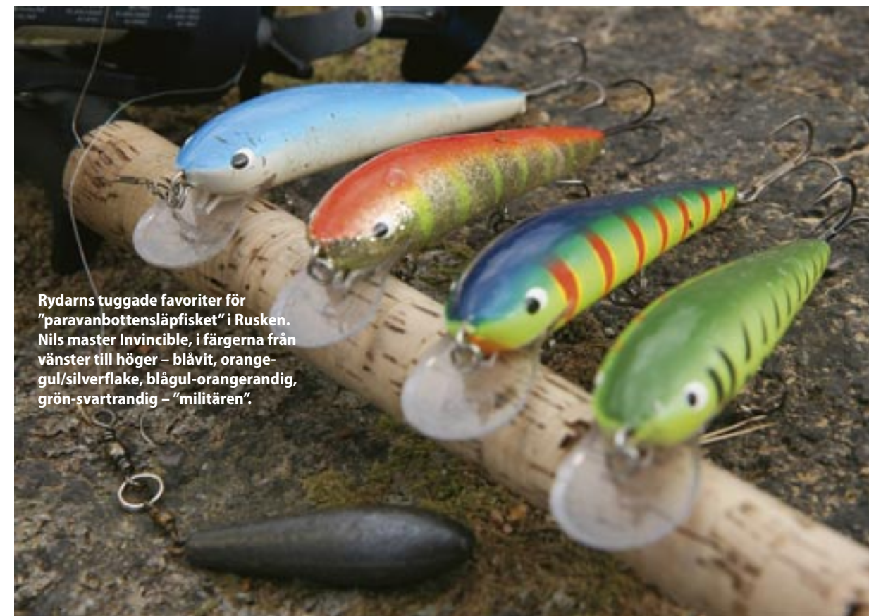
Rydarns tuggade favoriter för "paravanbottensläpfisket" i Rusken. Nils master Invincible, i färgerna från vänster till höger - blåvit, orange-gul/silverflake, blågul-orangerandig, grön-svartrandig - "militären".

av Sportfiskeforums bloggare. Jag får nöja mig med ett par stötar, en mindre gädda och en tandmärkt vit vertikaljigg.